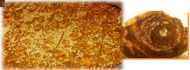
Λαδόπιτα και πατσούρα ⇨

Τις ολόθερμες ευχές μας στους απανταχού συχωριανούς για ΚΑΛΑ ΧΡΙΣΤΟΥΓΕΝΝΑ και ΚΑΛΗ ΧΡΟΝΙΑ