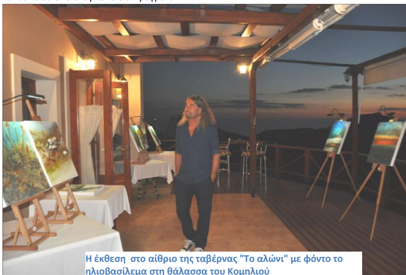
Η έκθεση στο αίθριο της ταβέρνας "Το αλώνι" με φόντο το ηλιοβασιλέμα στη θάλασσα του Κομηλιού