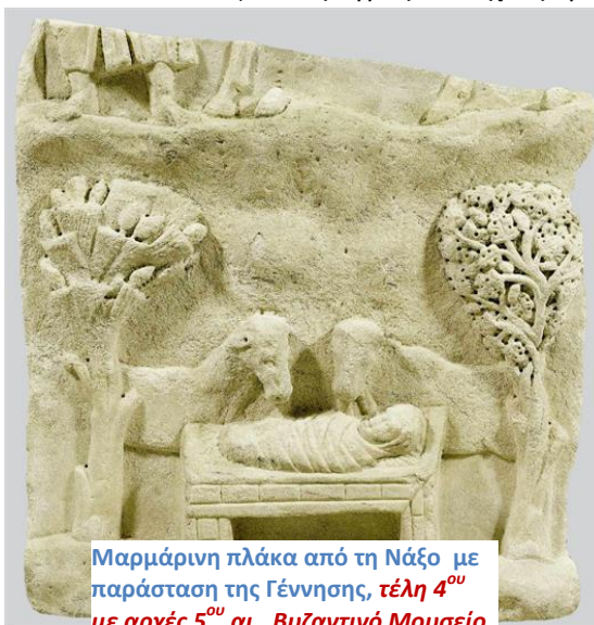
Μαρμάρινη πλάκα από τη Νάξο με παράσταση της Γέννησης, τέλη 4 ου με αρχές 5 ου αι., Βυζαντινό Μουσείο

(Τέλλος Άγρας, Είδα χθες βράδυ στ' όνειρό μου).