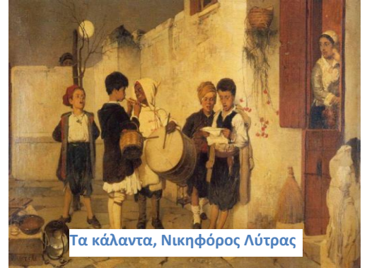
Τα κάλαντα, Νικηφόρος Λύτρας