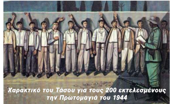
Χαρακτικό του Τάσου για τους 200 εκτελεσμένους την Πρωτομαγιά του 1944

Γεννήθηκε στη Λευκάδα το 1893. Γόνος εύπορης οικογένειας. Τελείωσε το Γυμνάσιο στη Λευκάδα. Απαστάχθηκε από μικρός τις μαρξιστικές ιδέες. Στέλεχος του ΚΚΕ με συνεχείς τλαιπωρίες από το 1932 και το ιδώνυμο με εξορία στον Άη Στράτη, επιστροφή το 1936 και σύλληψη του στη Λευκάδα και νέα εξορία στην Ανάφη. Πριν τελειώσει ο χρόνος της εξορίας του μεταφέρθηκε στις φυλακές Πύλου κι από κει στην Ακροναυπλία, εκεί τον βρήκαν οι Γερμανοί