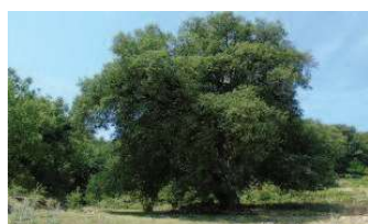
Η γηραιότερη δρυς (ρουπάκι) στη θέση «Μουσταφά» ηλικίας περίπου 1000 ετών

ροι» Νικιάνας αλλά και η Τοπική Κοινότητα και δεν απομένει παρά να υπάρξει συντονισμός κι από κοινού ενέργειες, δράσεις κι ό,τι άλλο απαιτηθεί για την υλοποίηση της πρότασης. Από κει και πέρα άμα υπάρχει διάθεση και ενδιαφέρον, ιδίως από την τοπική αυτοδιοίκηση και συγκεκριμένα το Δήμο, πολλά μπορούν να γίνουν μέσω του ΕΣΠΑ.