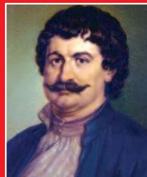
Ρήγας Φεραϊός (1757-1798)

Στις 24 Ιουνίου του 1798 ο Ρήγας Φεραϊός (Βελεστινλής) και οι επτά σύντροφοί του, αφού βασανίστηκαν φρικτά, στραγγαλίστηκαν στον Πύργο Νεμπόισα του Βελιγραδίου και τα άψυχα πτώματά τους ρίχτηκαν στο Δούναβη απ' τους Τούρκους (προηγούμενα είχαν παραδοθεί απ' την Αυστροουγγρική αστυνομία). Ο Ρήγας μεταξύ άλλων, είχε γράψει: