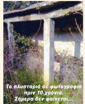
Το πλουσταριό σε φωτογραφία πριν 10 χρόνια. Σήμερα δεν φαίνεται...

Οι διαθέσιμοι εθελοντές επικοινωνήστε με τον Πρόεδρο!!!