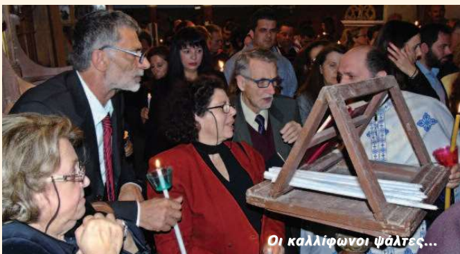
Οι καλλίφωνοι ψάλτες...

Πλήθος Αλεξαντριτών ανέβηκαν στους παλιούς οικισμούς και παρακολούθησαν τις ακολουθίες. Το πρόβλημα που παρουσιάστηκε με τους ψαλτάδες ξεπεράστηκε από εθελοντές καλλίφωνους.