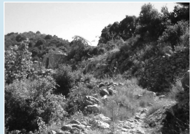
Γιάννης Σ. Βλάχος

Να φοράτε παπούτσια ορειβασίας, ελαφρύ ρουχισμό που να καλύπτει κατά προτίμηση όλο το σώμα, καπέλο και γυαλιά ηλίου, νερό, πρόχειρη ελαφριά τροφή, ατομικό φαρμακείο