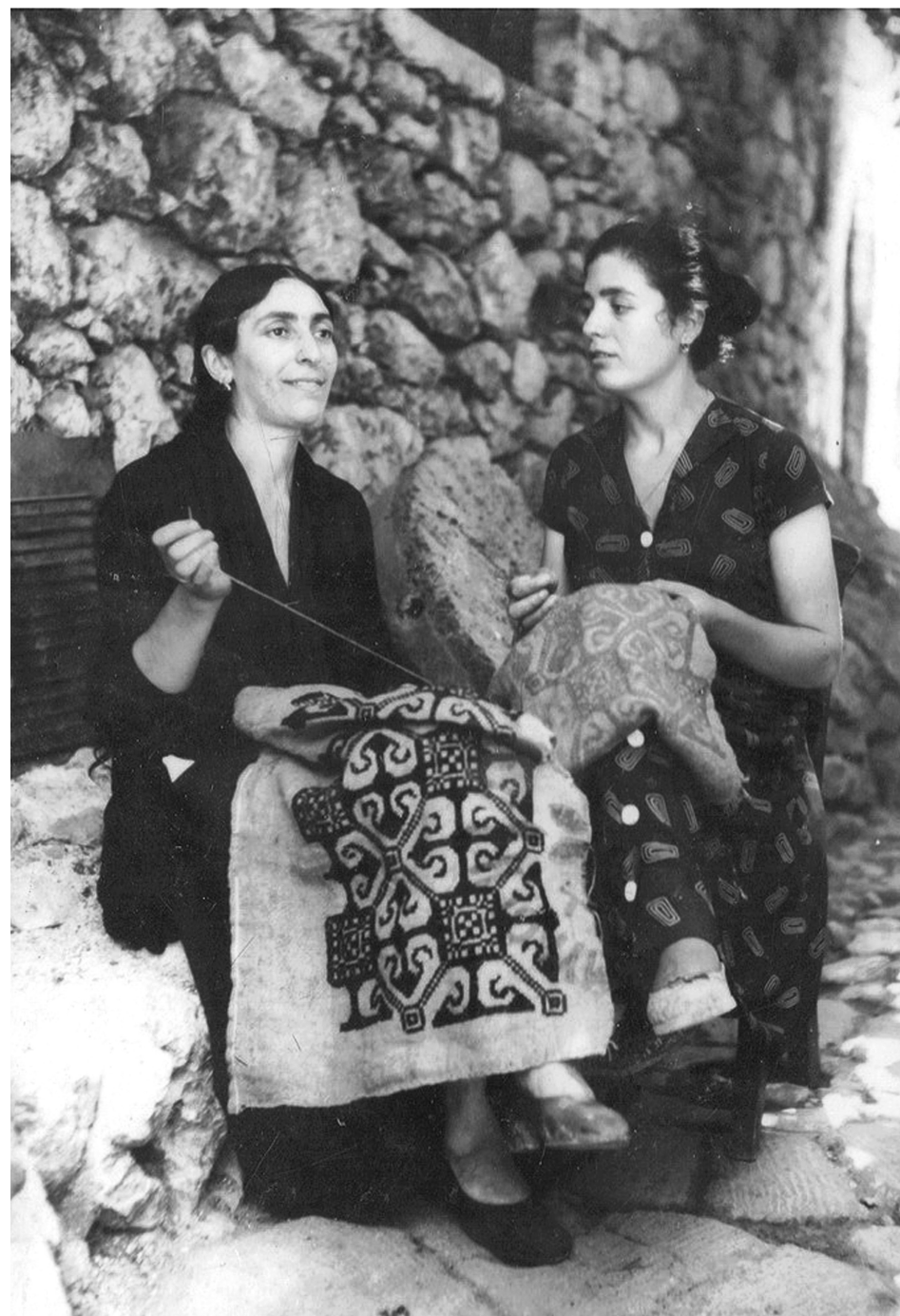
Κέντημα σε καντούνι στην Εξάνθεια. Από τη συλλογή «Κοπιάστε όπως... μας ήυρατε»

Ξαθείτιστα κυρά και θυγατέρα τι κεντάς; “πλήθος μικρά χωριά κεντάει, χωράφια ολούθε μ’ ολόχρυσια σπαρτά, με θημωνιές, με αλώνια, πράσινα αμπέλια αλλού, με κίτρινα σταφύλια, κίτρινα σαν φλουριά, κ’ μορφα κοπελούδια, που μπαίνουν με πλεκτά καλάθια και τρυγάνε.”