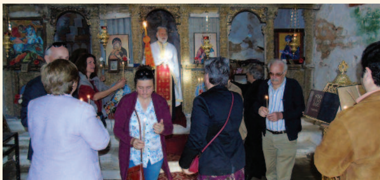
✓ Πανηγυρικός Εσπερινός στον Αγ. Γεώργιο στις 28 Απριλίου 2019.