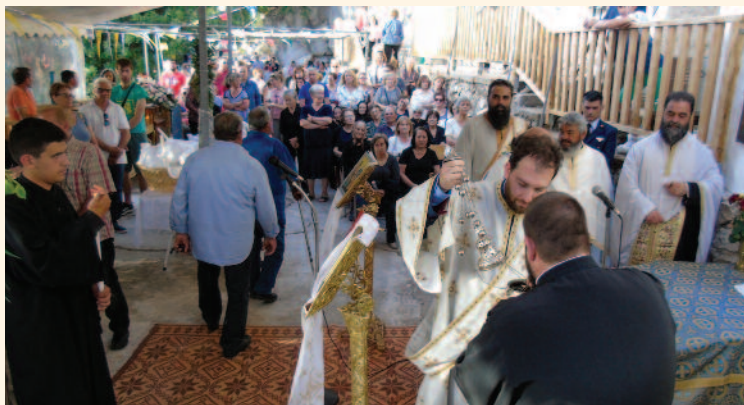
✓ Πανηγυρικός Εσπερινός στους Αγ. Πατέρες στις 9 Ιουνίου 2019.