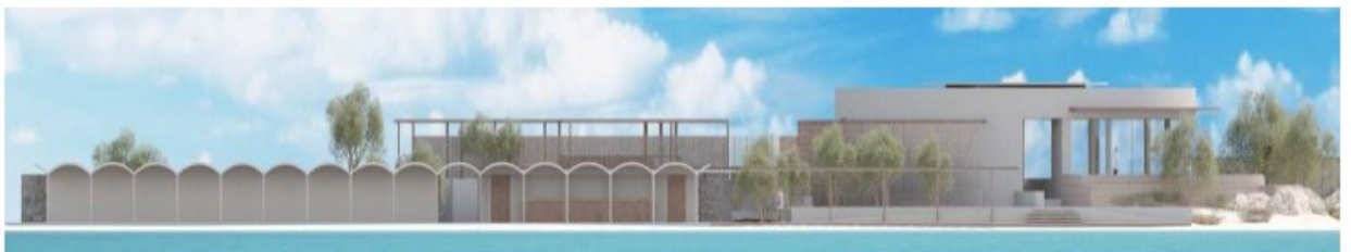
Λουτρικές Εγκαταστάσεις. Πρόταση Αποκατάστασης.