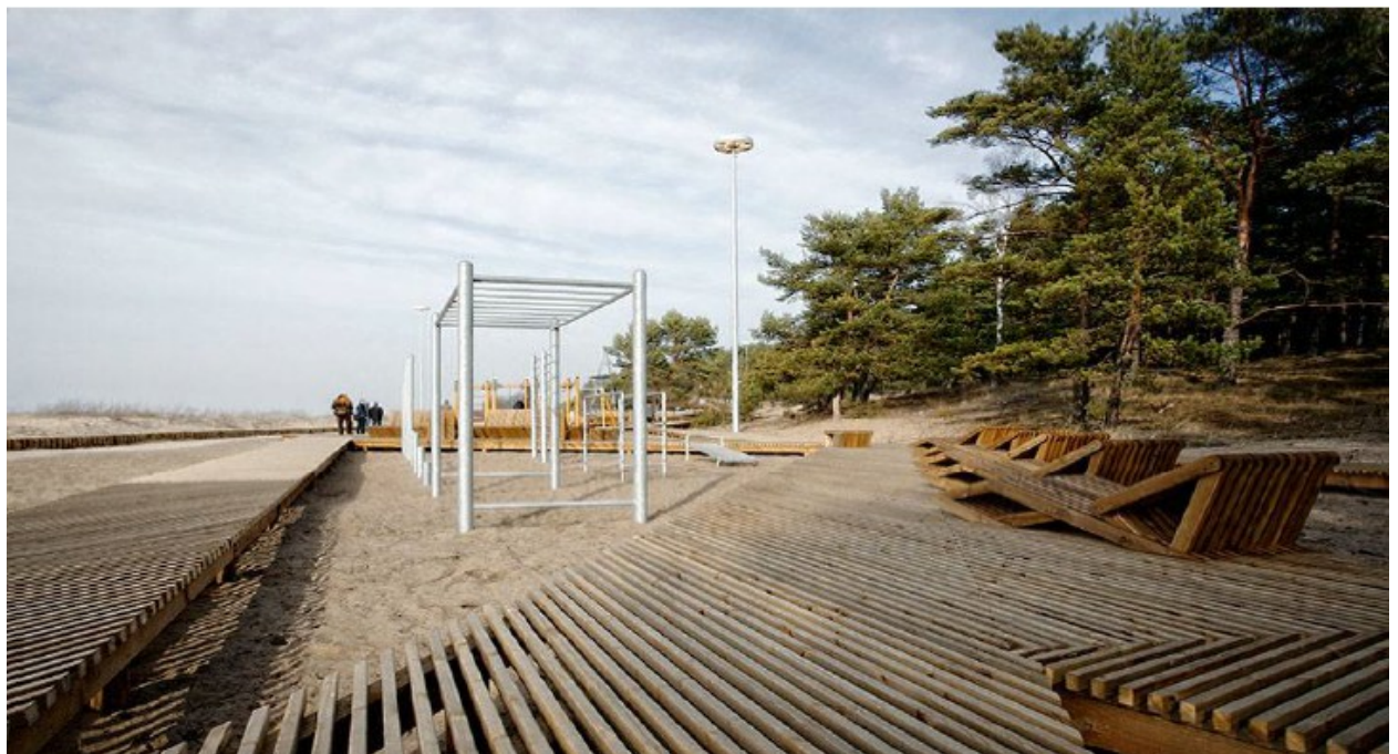
Διαμόρφωση περιβάλλοντος χώρου