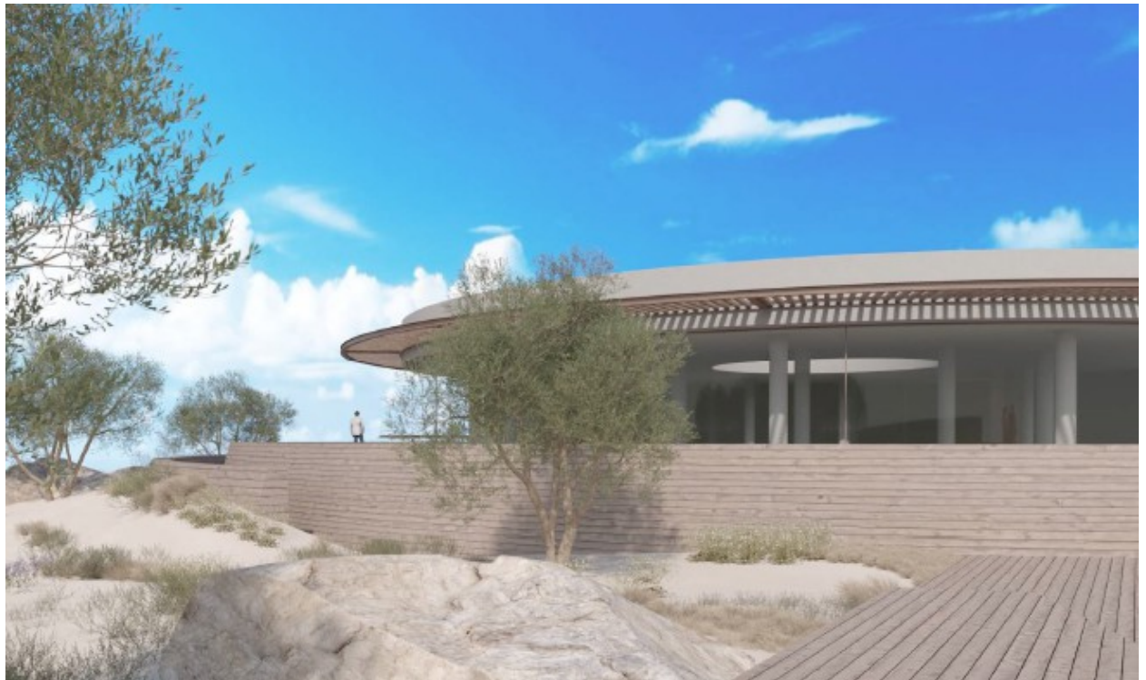
Διαμόρφωση περιβάλλοντος χώρου.