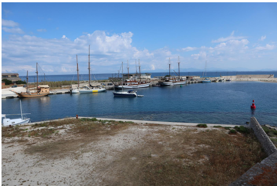
Αποψη του Τουριστικού Περιπτέρου από το Κάστρο Αγίας Μαύρας