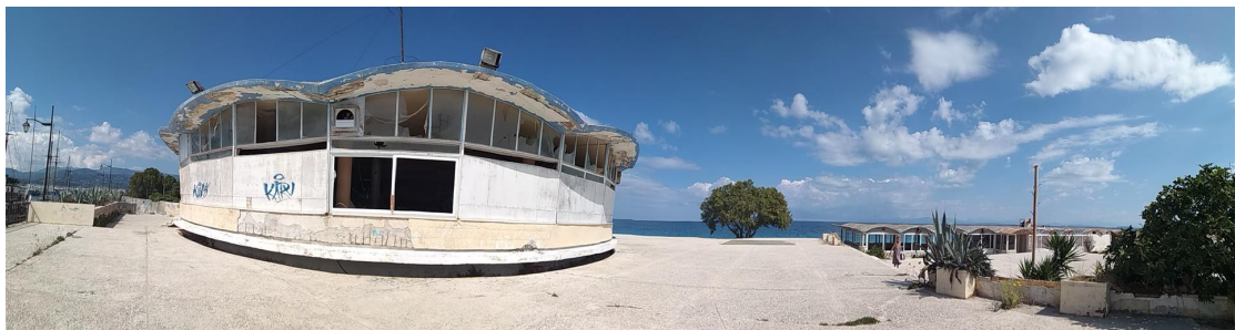
Τουριστικό Περίπτερο Λευκάδας και Λουτρικές Εγκαταστάσεις, υφιστάμενη κατάσταση.