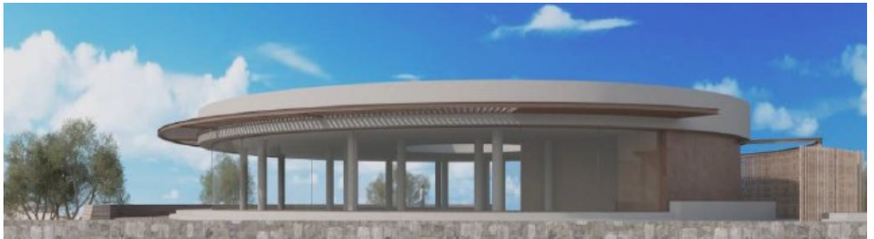
Τουριστικό Περίπτερο. Πρόταση αποκατάστασης.