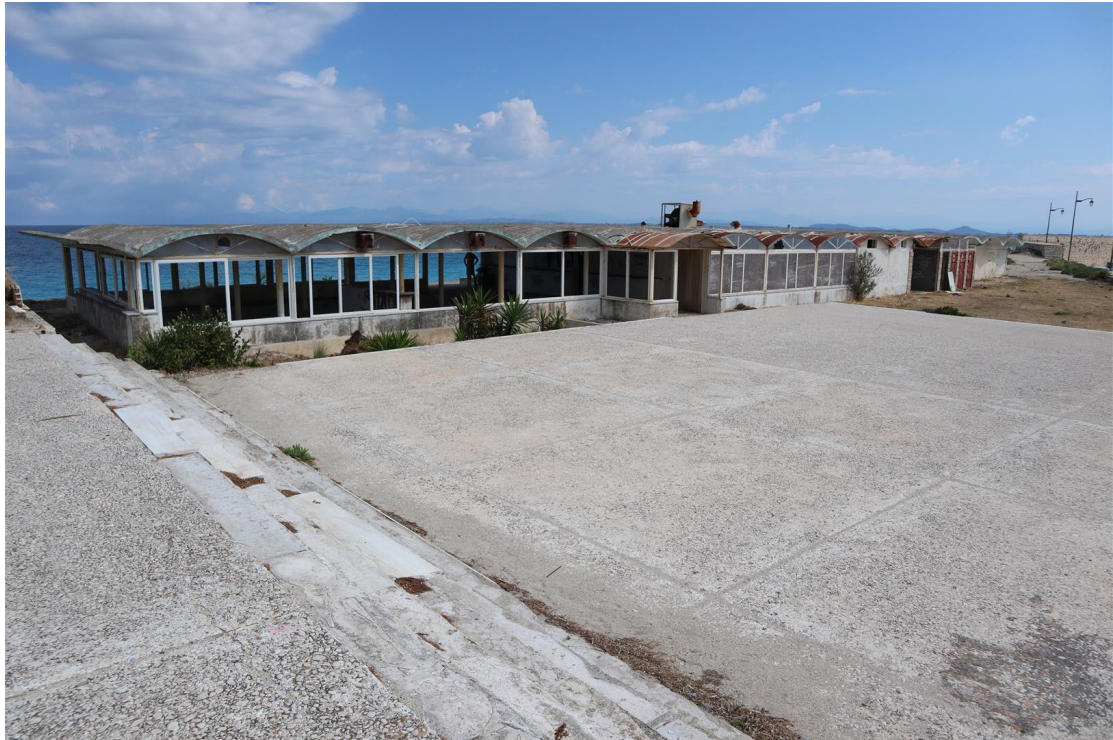
Περιβάλλον χώρος. Υφιστάμενη κατάσταση.