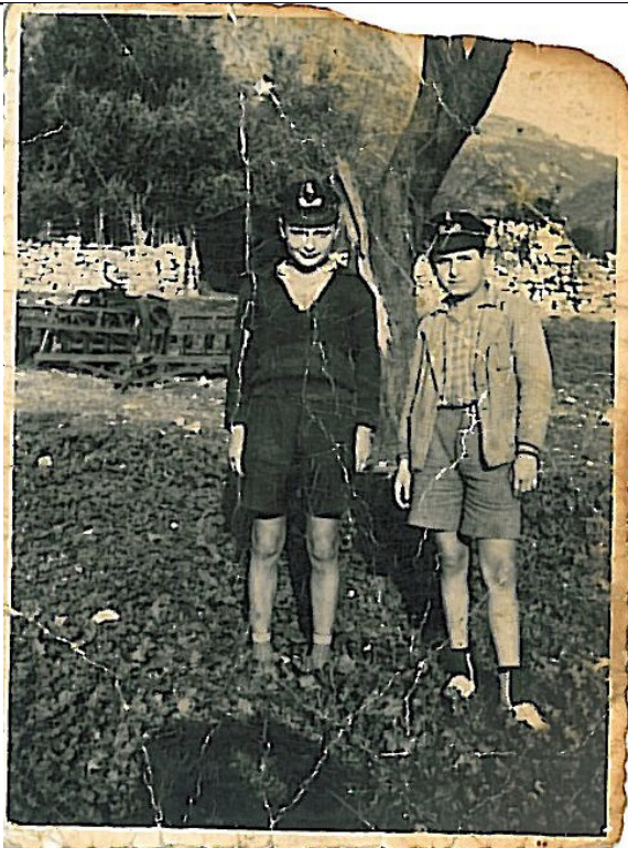
Φωτογραφικό Αρχείο Σταύρου Γεωργίου Παπαναστάση.