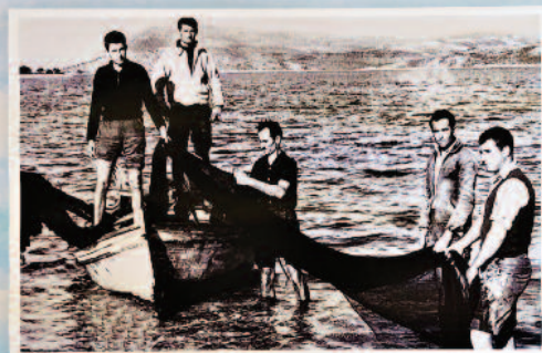
Αφιέρωμα στη διαχρονική σύνδεση του Αλέξανδρου με τη θάλασσα

θα ακολουθήσει γλεντι με ζωντανή μουσική στην ΠΛΑΤΕΙΑ του ΑΛΕΞΑΝΔΡΟΥ