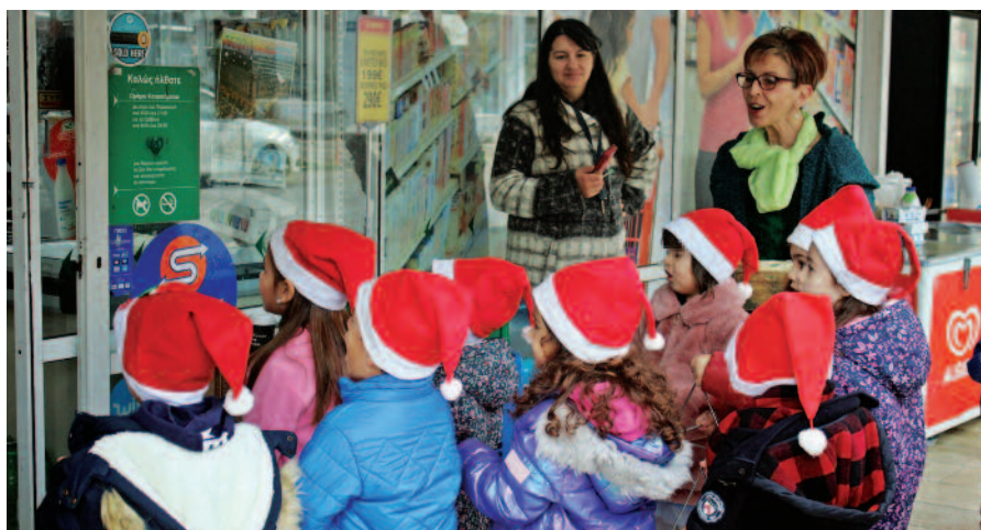
Τα παιδιά του Νηπιαγωγείου με τις δασκάλες τους στα χριστουγεννιάτικα κάλαντα στη Νικιάνα.