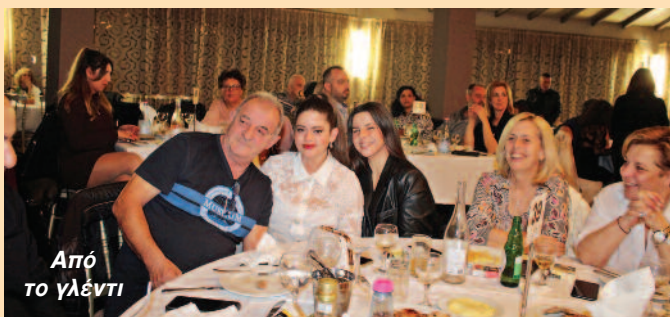
Από το γλέντι

Ο ΠΟΛΙΤΙΣΤΙΚΟΣ ΣΥΛΛΟΓΟΣ ΝΙΚΙΑΝΑΣ «ΟΙ ΣΚΑΡΟΙ» πραγματοποίησε με επιτυχία στις 16 Δεκεμβρίου 2023 την προγραμματισμένη Παραδοσιακή του Βραδιά, η οποία, για ακόμη μία φορά, κύλησε με μεγάλη συμμετοχή και πολύ κέφι. Για την επιτυχία της εκδήλωσης, που κατά γενική ομολογία ήταν μεγάλη, ευχαριστούμε από καρδιάς: