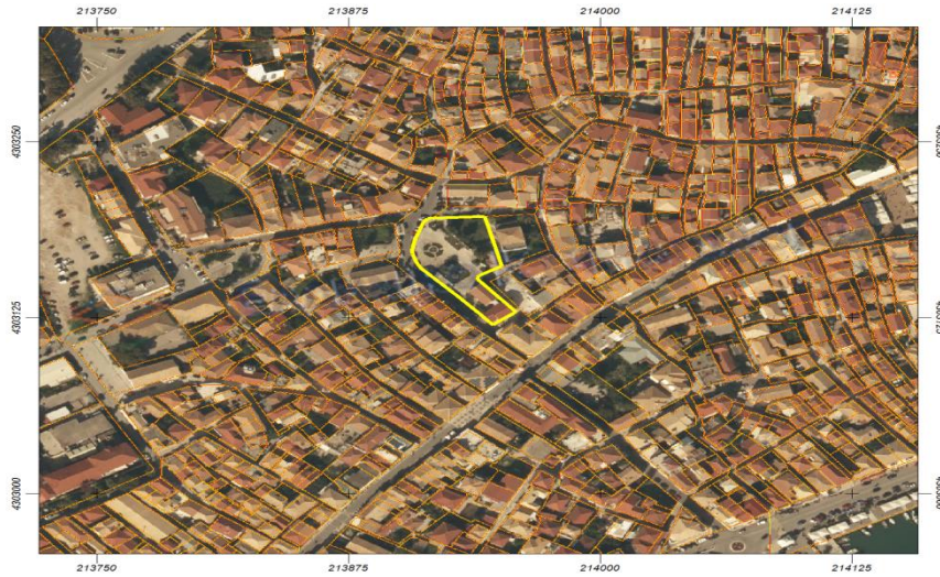
Εικόνα 1 Απόσπασμα ορθοφωτοχάρτη_Ιδ/σια με ΚΑΕΚ 340260213001