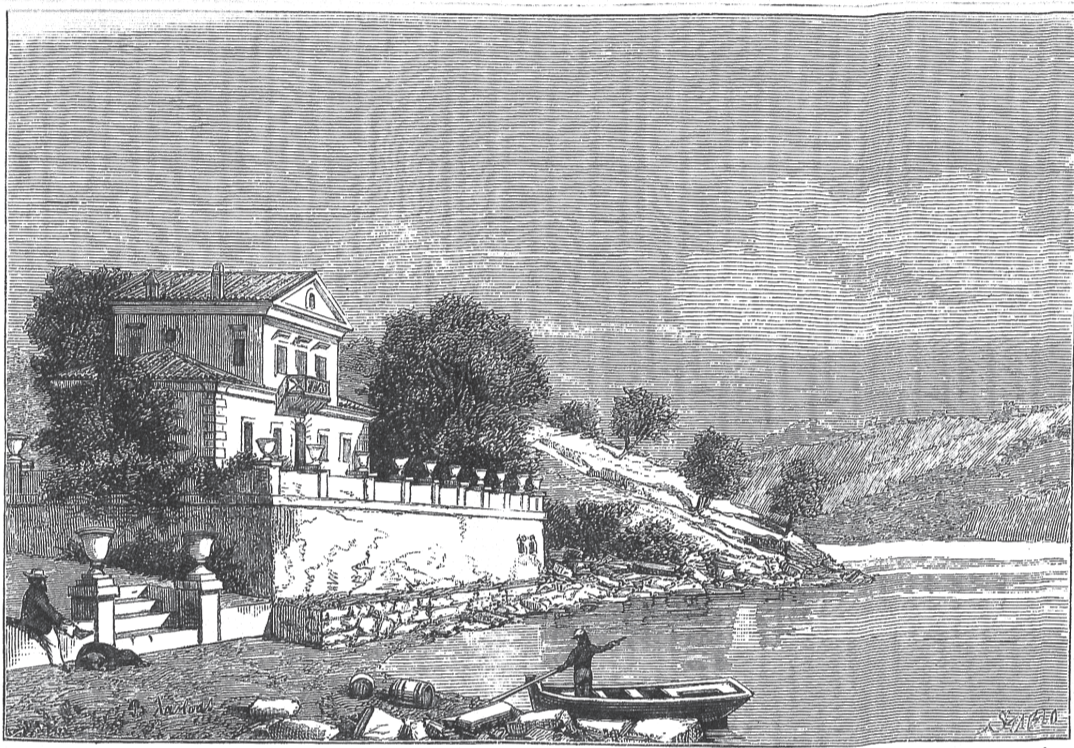
Η ΜΑΔΟΥΡΗ. [Έγγραφο υπό Λάντσα]